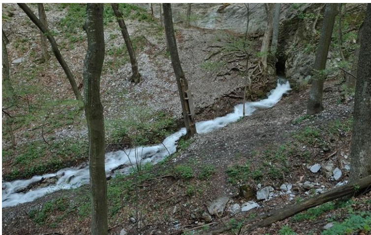
Az Imó-forrás távolról

Amikor beteltek a látvánnyal, felkapaszkodtak az Imó-kőre , hogy távolabb lássanak.