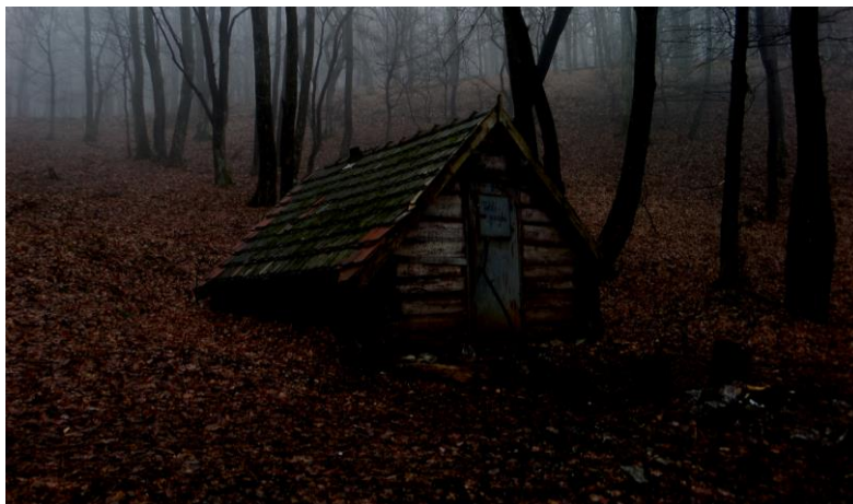
A viharban az esti homályba burkolózó Toldi kunyhót pillantják meg

—Gyertek! Gyertek! Igyekeztek minél gyorsabban, mert ott, kívül, az élet semmit sem ér!