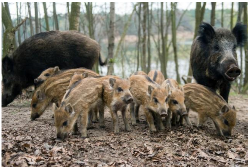
Vaddisznó konda éberrel figyeli a betolakodókat

emelkedője felé, elvonul a nyugalmaiban megzavart konda. Sok, csíkos kismalac volt látható a nyájban, melyeket több anyadisznó és néhány agyaras kan, haragos rőfögés mellett kísért az emelkedő felé. Nem tellett el ötpercnyi idő sem, amikor eltűntek a turisták szemei elől.