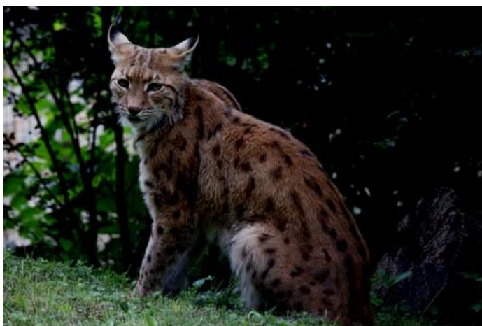
Prédára várakozó hiúz

Nem oly távolról bagoly huhogás hallatszott. Ez az ismétlődő huhogás tovaterjedt a hegyek között, vagy a bércekről visszaverődött. Így aztán ember legyen a talpán, aki megtudná mondani, valójában melyik irányból jönnek az eredeti hangok. A társát, akinek jelzett, már nem csapták be a hangokat visszaverő hegyek ormai. Pontosan tudta, hol vár rá a párja, akit a vihar szakított el tőle. A huhogást hallva, felröppent a fáról és az éjjel is látó szemei segítségével biztonságosan repült a besötétedet erdő sűrű fáinak között.