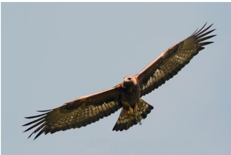
Vadászgató karvaly éberen köröz a légtérben

Megélénkült az itthon telelő madarak világa, akik a vándormadarak visszaérkezésével megsaporodtak. A busz ablakán kitekintve, a fák fölötti légtérben, karvaly körözött szélesre tárt szárnyaival. Éles szemeivel figyelte az alatta felbukkanható eleséget, hogy aztán hirtelen lecsapjon áldozatára.