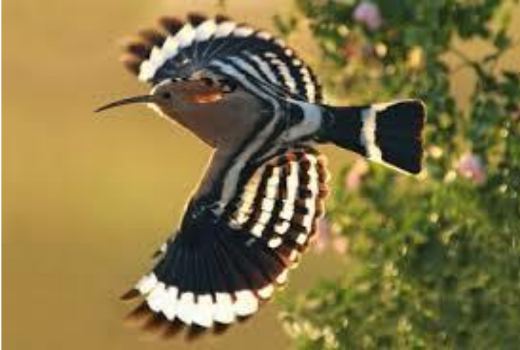
A káprázatos tollazatú bübosbanka libben a fák fölött

A délről visszatérő vándormadarak sokasága röpködött a tavasszal megújuló erdőben. Talán a tavalyi fészkeket keresték, melyeket a téli viharok megtépáztak annyira, hogy teljesen újjá kell építeni. Amelyik már elkészítette az idei fészket, a tojásokat bele tojva, nagy reményekkel ült a tojásain.