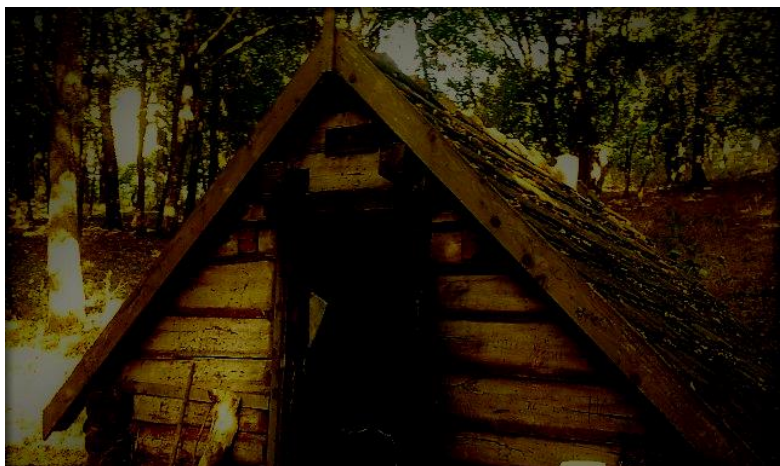
A Toldi kunyhó az esti szürkületben, közelről

A kunyhó egyik sarkában, a pókháló fogságában, egy csodálatos színekkel megáldott lepke verdesett kinyjában, melyre már a prédára leső pók szemet vetett és gyorsan közeledett feléje. A betolakodók megjelenése mentette meg a színes pillangó életét, akik saját gondjukat most feledve, kiszabadították a fogságba esett áldozatot.