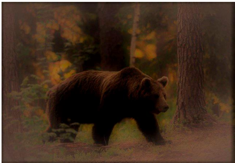
Magányos medve óvatosan lopakodik a Toldi kunyhóhoz

Pissz! Maradj csendben! A fenevad érzi, hogy bent vagyunk. – suttogta, miközben ő is egyfolytában remegett.