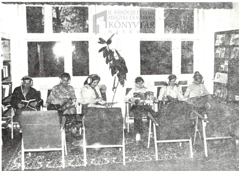
Zenehallgatók az edelényi nagyközségi-járási könyvtárban