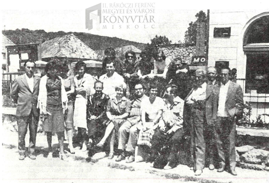
Az igazgatói értekezlet résztvevői az aggteleki Petőfi Emelékkönyvtár előtt

Don Carlos. Ő (Hölgyfutár 1851—56.) Kelemér (Magyar Írók Füzetei 1850.) Muky (Napkelet 1857.) Vén Bakancsos (Fővárosi Lapok Új-Budapest 1874—78.) Sánta Ördög (Bolond Miska Krinolin Naptár) Vas Villa (Üstökös) Károly bácsi (Kis Lap). B. b—c. —b —cz, A+B. s*, + + + (Hölgyfutár, Ország, s a Hon) Feljegyzí Szinnyei József: Magyar Írók élete és munkái I. Budapest, 1891. 193—196. l.