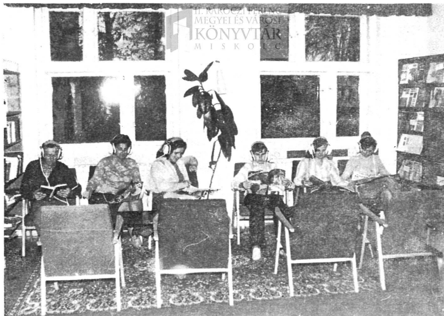
Zenehallgatók az edelényi nagyközségi-járási könyvtárban