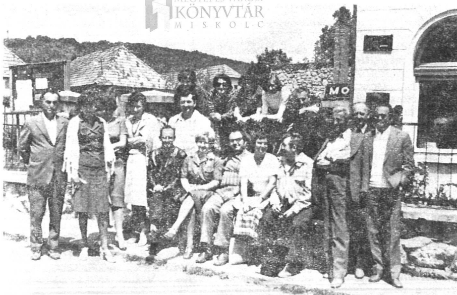
Az igazgatói értekezlet résztvevői az aggteleki Petőfi Emelékkönyvtár előtt

II. RÁKÓCZI FERENC MEGYEI ÉS VÁROSI KÖNYVTÁR MISKOLC