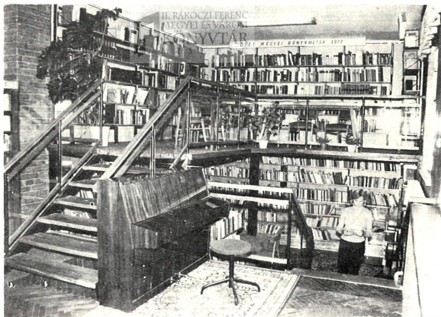
Az edelényi nagyközségi-járási könyvtár olvasóterme