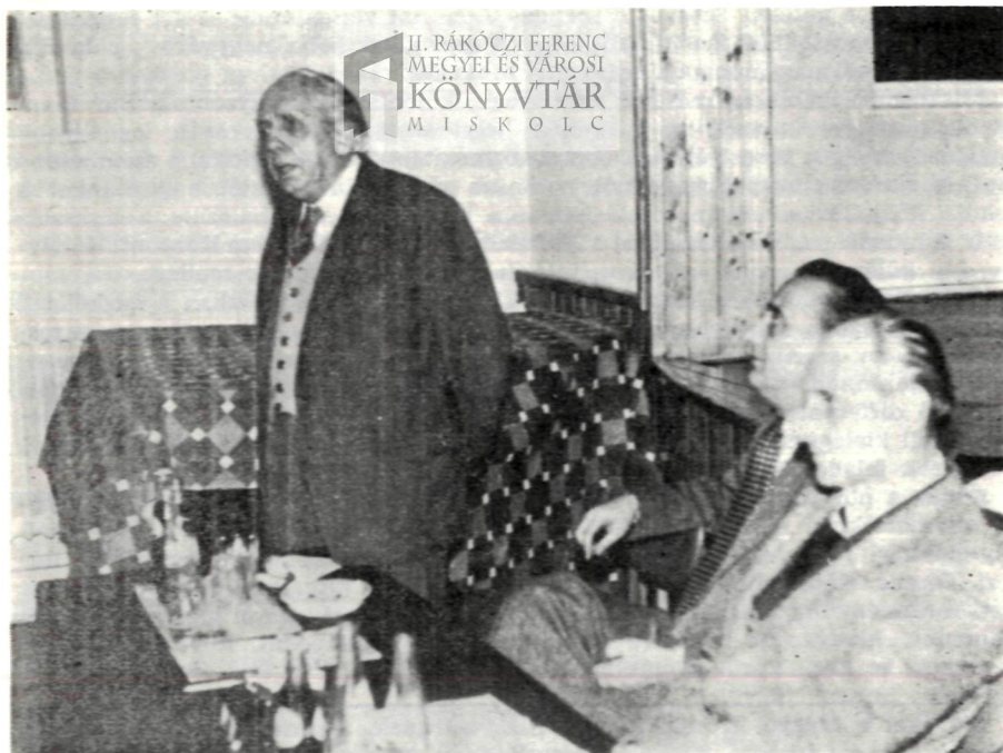
Buga doktor beszél a Borsodszirákon megtartott Szabad Föld-esten