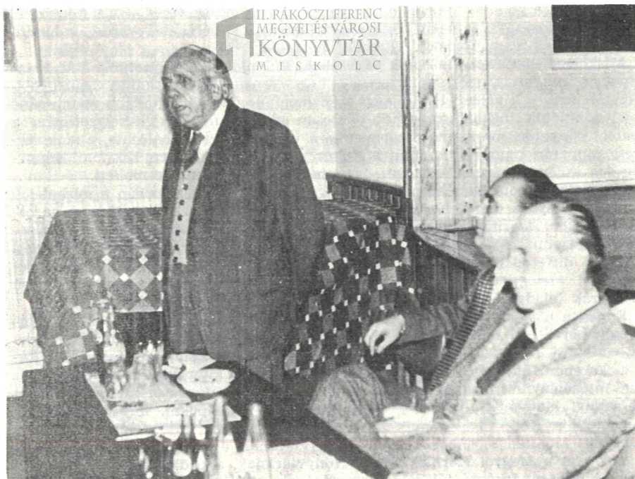
Buga doktor beszél a Borsodszirákon megtartott Szabad Föld-esten