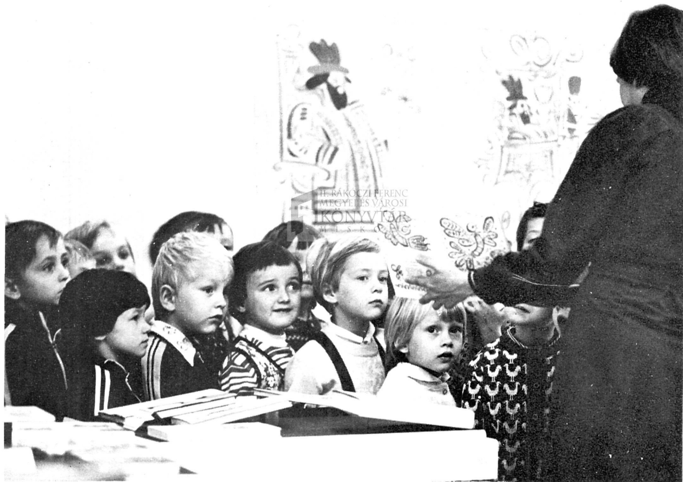
„Gyermekkönyv-illusztrátorok — gyermekkönyvek” című kiállítás látogatói a József Attila Könyvtárban