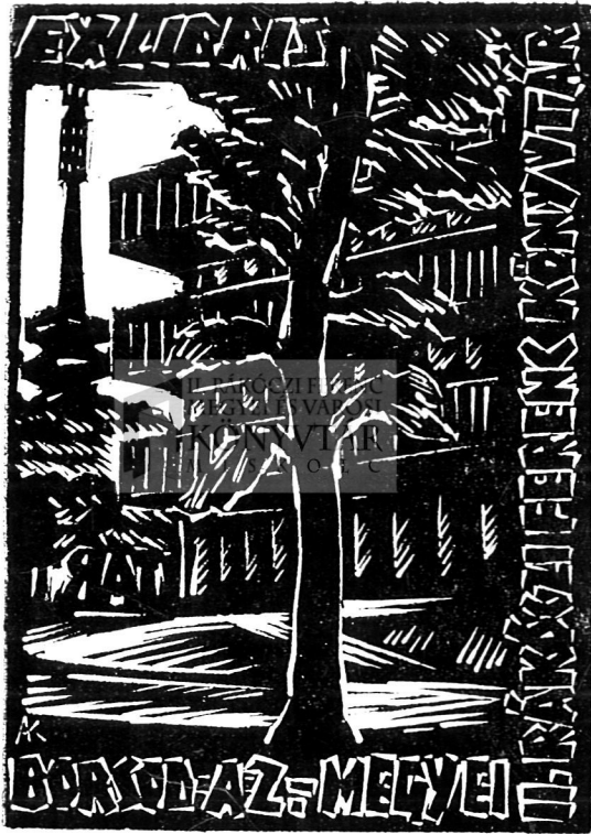
Andraskó Károly ex librise