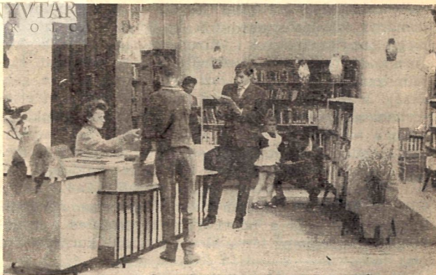
Részletek a farkaslyuki könyvtár kölcsönzői teréből

Ünnepélyes keretek között a Bányász Napon került sor a farkaslyuki szakszervezeti könyvtár átadására. A központi fűtéses és klubszerűen berendezett könyvtár közel kétezer bányászdolgozó, valamint a település lakosainak igényeit elégíti ki. A korszerű szabadpolcos könyvtárat cukrászdából és hivatali helyiségből alakították ki, amely így most egy nagy kölcsönzői és olvasói térből és raktárból áll. A polcokon jelenleg 5000 kötet könyv közül válogathat az olvasó, de megtalálhatók a jelentősebb napilapok és folyóiratok is. A korszerűsített könyvtár megnyitása óta