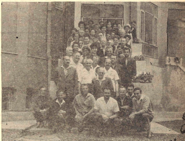
A sátoraljaújhelyi tanfolyam hallgatói