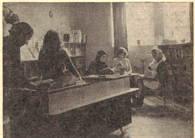
Találkozott a múlt és jelen a cigándi könyvtárban

A hálózatban 78 198 kötet könyv áll rendelkezésére a 12 275 olvasónak, s 1964-ben 270 775 kötetet olvastak