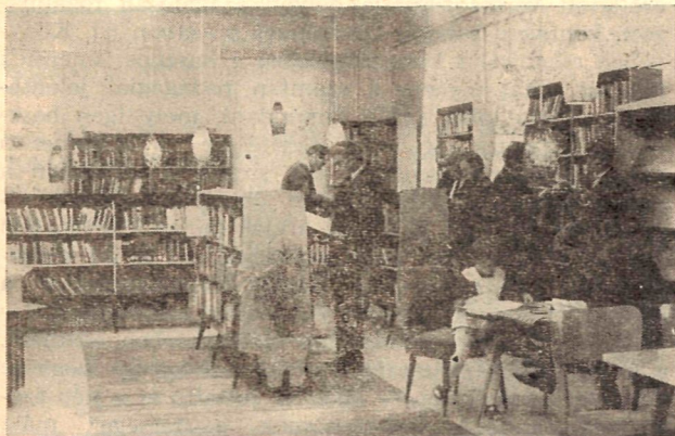
Folyik a válogatás a szabadpolcos kölcsönzői térben Farkaslyukon.

ugrásszerűen emelkedik a forgalom. A dolgozók szívesen keresik fel és sokkal több időt töltenek olvasással helyben is, mint a rendkívül mostoha körülmények között működő régi könyvtárban. De nemcsak az olvasók keresik fel, hanem tapasztalatszerző céljából a megye különböző üzemeiből gyakoriak a látogatások.