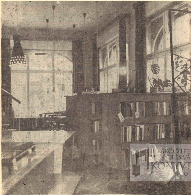
Részlet a felnőttek könyvkiválasztójából

Láttunk már ebben a könyvtárban ötletes, ügyes könyvkiállítást, de kevés a könyvismertetés, könyvankét. Ez a könyvtár helyet tud adni egy olvasói klubnak, aminek a gondolata már egy éve érik, s a kultúrotthonban működő klubok sikere — amiben egyébként része van a könyvtárnak is — bizonyítja, hogy van létjogosultsága. S ha a létszámproblémák megoldódnak, hisszük, hogy sikerrel mutatnak ebben is példát Sátoraljaújhelyen.