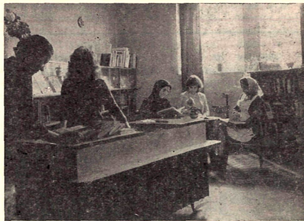
Találkozott a múlt és jelen a cigándi könyvtárban

A hálózatban 78 198 kötet könyv áll rendelkezésére a 12 275 olvasónak, s 1964-ben 270 775 kötetet olvastak