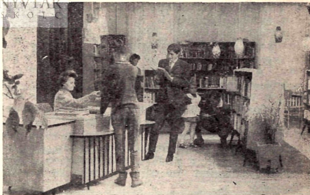
Részletek a farkaslyuki könyvtár kölcsönzői teréből

ugrásszerűen emelkedik a forgalom. A dolgozók szívesen keresik fel és sokkal több időt töltenek olvasással helyben is, mint a rendkívül mostoha körülmények között működő régi könyvtárban. De nemcsak az olvasók keresik fel, hanem tapasztalatsere céljából a megye különböző üzemeiből gyakoriak a látogatások.