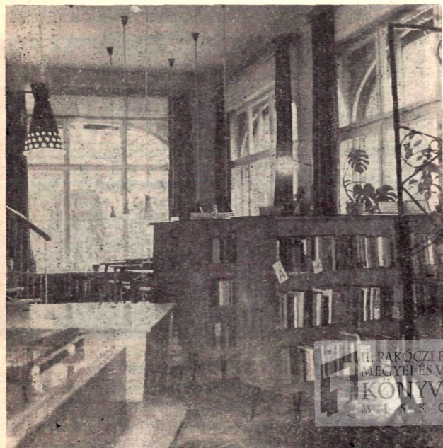
Részlet a felnőttek könyvkiválasztójából

A gyermekekkel való foglalkozás igen jó irányban halad, mesedélutánok, fejtörők, pályázatok jelzik, hogy itt nemcsak könyvet adnak a gyermekek kezébe, de szeretnének olvasásuk színvonaláról meg is győződni. A város valamennyi iskolájában van iskolai könyvtár, de kis állományuk miatt elsősorban a járási könyvtár látja el a tanulókat olvasnivalóval.