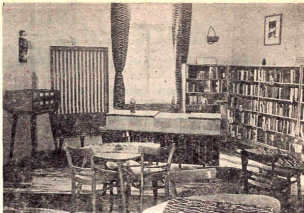
Az újonnan átalakított fiókkönyvtár

Láttunk már ebben a könyvtárban ötletes, ügyes könyvkiállítást, de kevés a könyvismertetés, könyvankét. Ez a könyvtár helyet tud adni egy olvasói klubnak, aminek a gondolata már egy éve érik, s a kultúrotthonban működő klubok sikere — amiben egyébként része van a könyvtárnak is — bizonyítja, hogy van létjogosultsága. S ha a létszámproblémák megoldódnak, hisszük, hogy sikerrel mutatnak ebben is példát Sátoraljújhelyen.