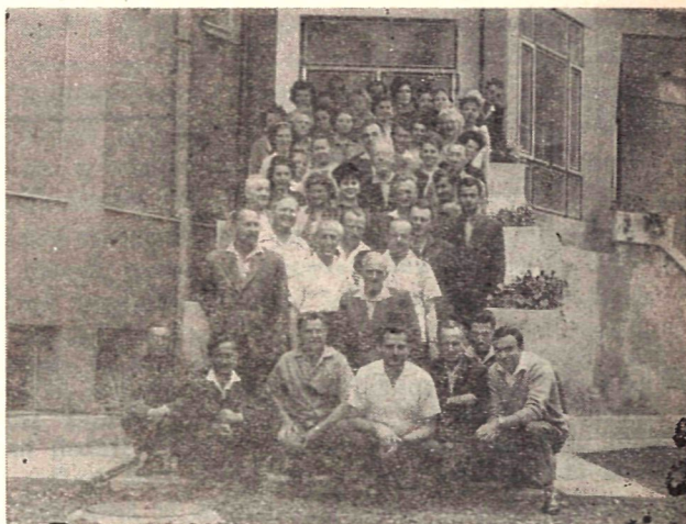
A sátoraljaújhelyi tanfolyam hallgatói