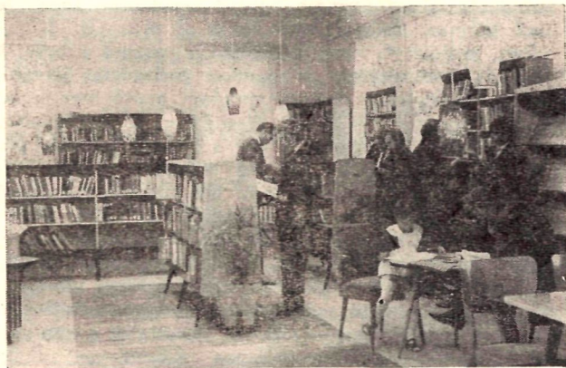
Folyik a válogatás a szabadpolcos kölcsönzői térben Farkaslyukon.

Ünnepélyes keretek között a Bányász Napon került sor a farkaslyuki szakszervezeti könyvtár átadására. A központi fűtéses és klubszerűen berendezett könyvtár közel kétezer bányászdolgozó, valamint a település lakosainak igényeit elégíti ki. A korszerű szabadpolcos könyvtárat cukrászdából és hivatali helyiségből alakították ki, amely így most egy nagy kölcsönzői és olvasói térből és raktárból áll. A polcokon jelenleg 5000 kötet könyv közül válogathat az olvasó, de megtalálhatók a jelentősebb napilapok és folyóiratok is. A korszerűsített könyvtár megnyitása óta