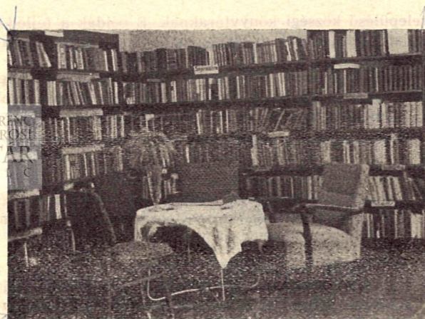
A putnoki járási könyvtár szabadpolcos kölcsönzője.