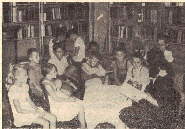
Meseóra a mezőkövesdi ifjúsági könyvtárban.