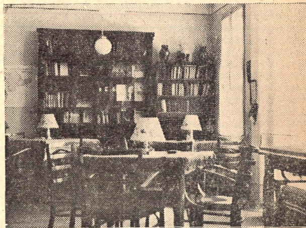
A könyvtár olvasótermében lévő kézikönyvtárat a szakemberek gyakran használják.

A könyvtár keretén belül külön működik gyermekrészleg. A gyermekkölcsönzöt 1953-ban választották