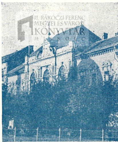
II. Rákóczi Ferenc Könyvtár.