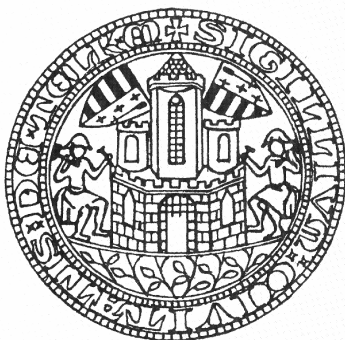
Telkibánya középkori várospecsétjének rajza. (14. sz.)

Zágráb 36, 47, 127 Zagyva folyó 127 Zala vármegye 12 Zalatna (Zalathna, Zlathnyabania) 130, 145 Zarbouth 112 Zazurbánya (Szazár, Szazárhegy) 117, 119 Zemplén vármegye 89, 91-93, 112, 150 Zennabánya 150 Zipser Neudorf I. Igló Zólyom 40, 120 Zólyom vármegye 39, 44, 47, 54, 56, 58, 61, 69, 82, 8 Zsakaróc (Soekelsdorf) 97