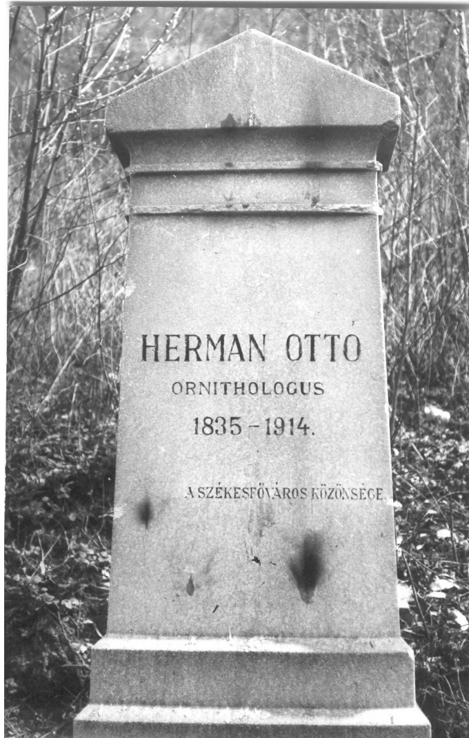
Herman Ottó korábbi síremléke a hámosi temetőben