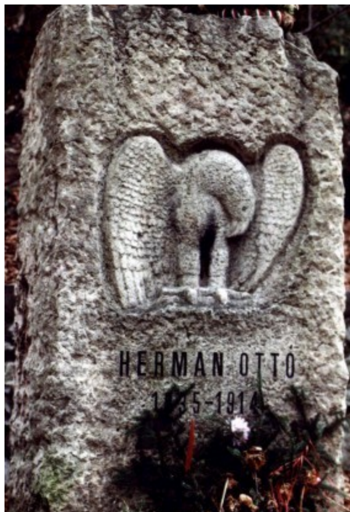
Herman Ottó síremléke a hámosi temetőben