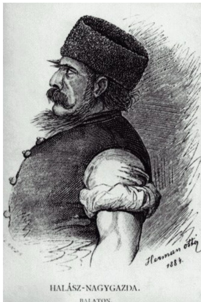
Herman Ottó rajza a Magyar halászat c. könyvéből