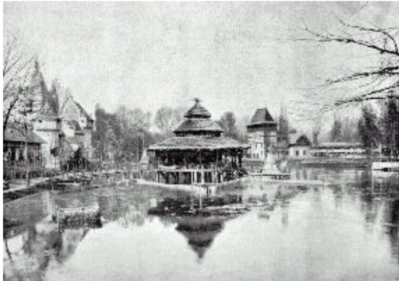
Az ezredéves kiállítás halászati pavilonja